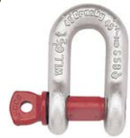
G-210 / S-210

G-210 Los grilletes de perno roscado para cadena cumplen la Especificación Federal RR-C-271F, Tipo IVB, Grado A, Clase 2, excepto por las estipulaciones exigidas del contratista. Para mayores informaciones vea la página 444.