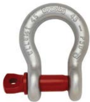
G-209 / S-209

G-209 Los grilletes tipo ancla con perno roscado cumplen con la Especificación Federal RR-C-271F Tipo IVA, Grado A, Clase 2, excepto por las estipulaciones exigidas del contratista. Para mayores informaciones vea la página 444.